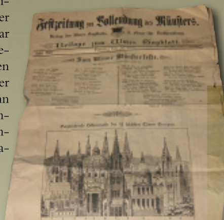
Links: Festzeitung zur Fertigstellung des Ulmer Münsters

Zum Tätigkeitsfeld des Unternehmens gehören aber auch Restaurierungen sowie die Fertigung von Skulpturen und Brunnen. So hat die Firma u.a. an der Sanierung der Klosterkirche Wiblingen, der Bundesfestung Ulm, des Ulmer Rathauses, der Georgskirche und dem Hauptsitz der Ulmer Volksbank mitgewirkt.