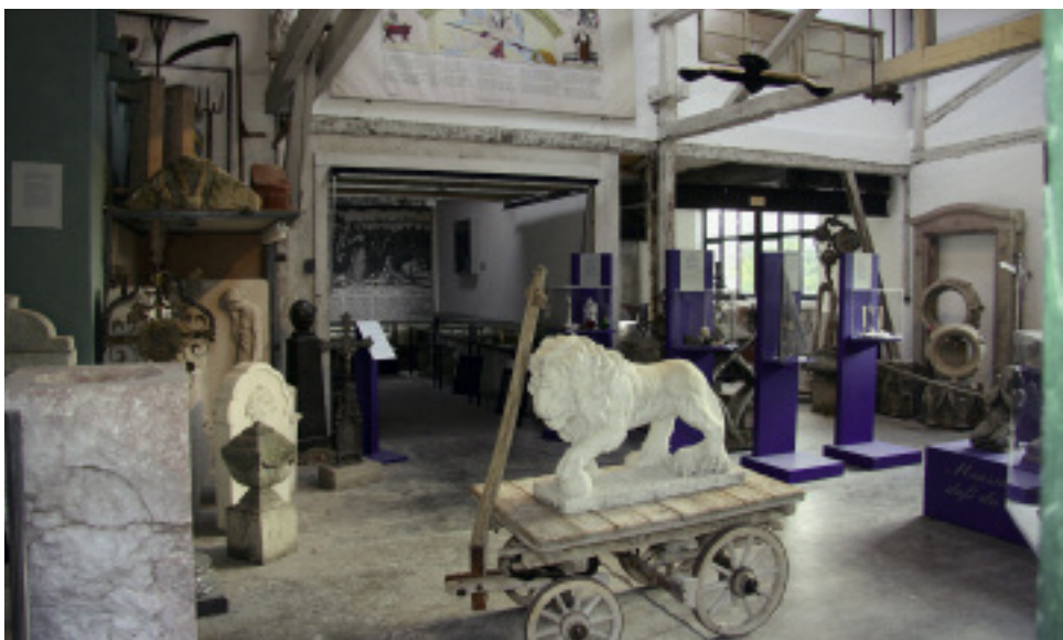
Blick ins Museum, noch mit Exponaten aus dem Museum für Sepulkralkultur

Das Unternehmen beschäftigt zwölf Mitarbeiter, unter ihnen mehrere Bildhauermeister und Steintechniker. Einen Teil der Werkzeuge stellt die Firma nach wie vor in der eigenen Schmiede her.