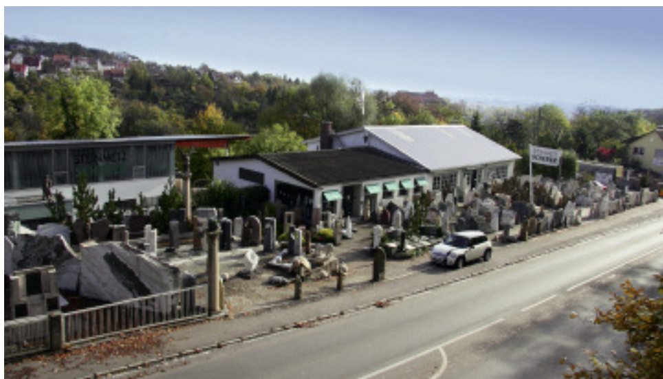
140 Jahre alt und quicklebendig: der Steinmetzbetrieb Scherer am Ulmer Hauptfriedhof