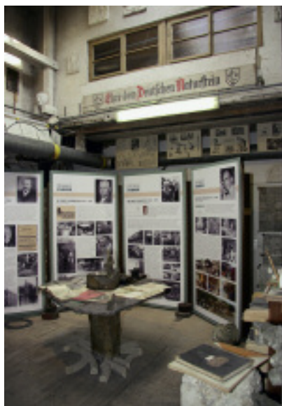
Die Firmentradition ist gut dokumentiert.