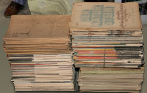
Steinmetz-Fachliteratur in Hülle und Fülle

Seit fünf Generationen arbeitet die Steinmetzfamilie Scherer in Ulm und um Ulm herum. Anlässlich des 140-jährigen Bestehens ihres Betriebs hat sie auf dem Firmengelände ein sehenswertes Steinmetz-Museum eröffnet.